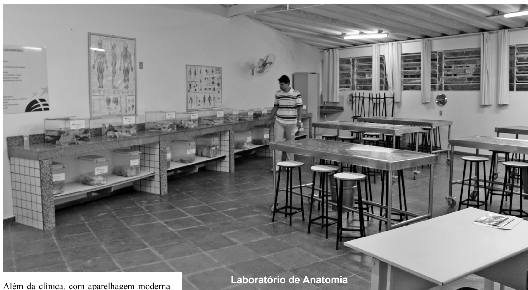
Laboratório de Anatomia

Outro trabalho muito elogiado pela comissão de reconhecimento do MEC foi a Clínica Escola, não somente por sua infra-estrutura, como também pela organização e funcionamento, atendendo à população e proporcionando a prática das teorias estudadas em sala de aula.