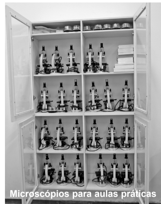
Microscópios para aulas práticas