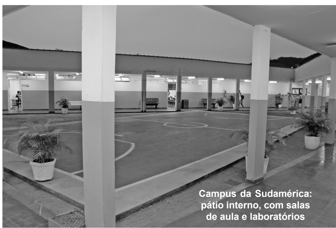
Campus da Sudamérica: pátio interno, com salas de aula e laboratórios