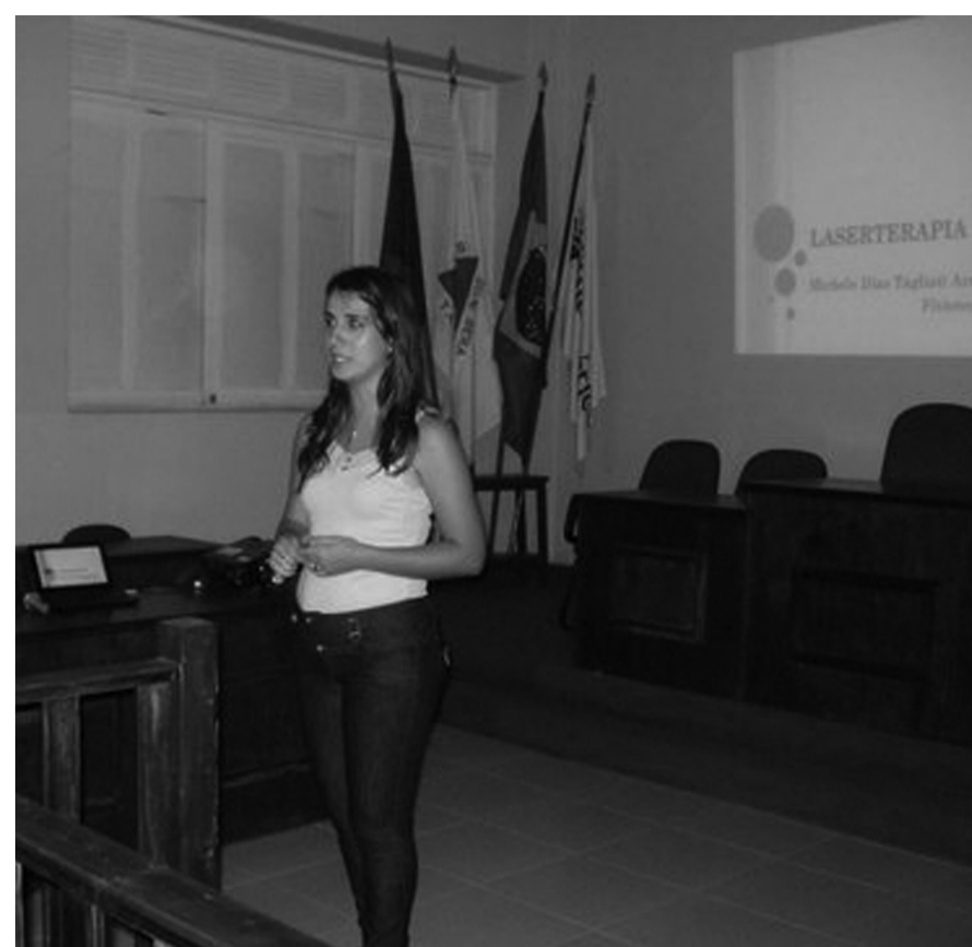
Palestrantes apresentam seus estudos sobre o método do Pilates e sobre Laserterapia

A VII Semana Acadêmica de Fisioterapia da Sudamérica foi realizada de 28 de outubro a 2 de novembro deste ano, com a presença dos estudantes do curso e de profissionais da área. As palestras aconteceram no dia 28, na Casa de Inclusão Social (Núcleo de Práticas Jurídicas) mantida pela instituição, em frente ao Mercado do Produtor, na Vila Domingos Lopes. Fizeram parte, também, da programação, minicursos e uma atividade de extensão comunitária.