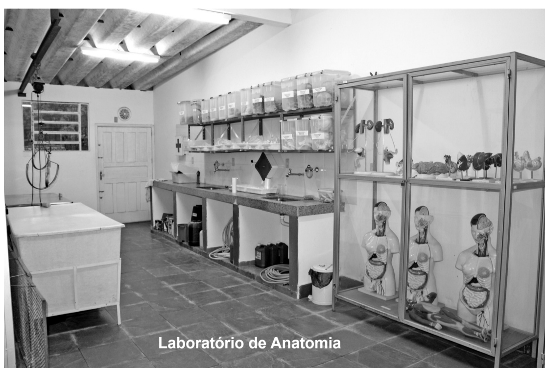
Laboratório de Anatomia