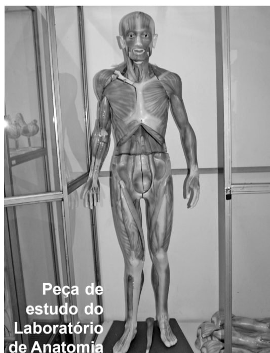
Peça de estudo do Laboratório de Anatomia