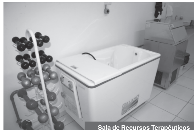
Sala de Recursos Terapêuticos