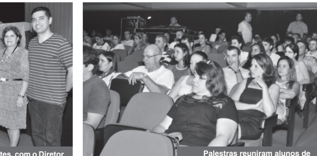
Palestras reuniram alunos de todos os períodos do curso, no Centro Cultural Humberto Mauro