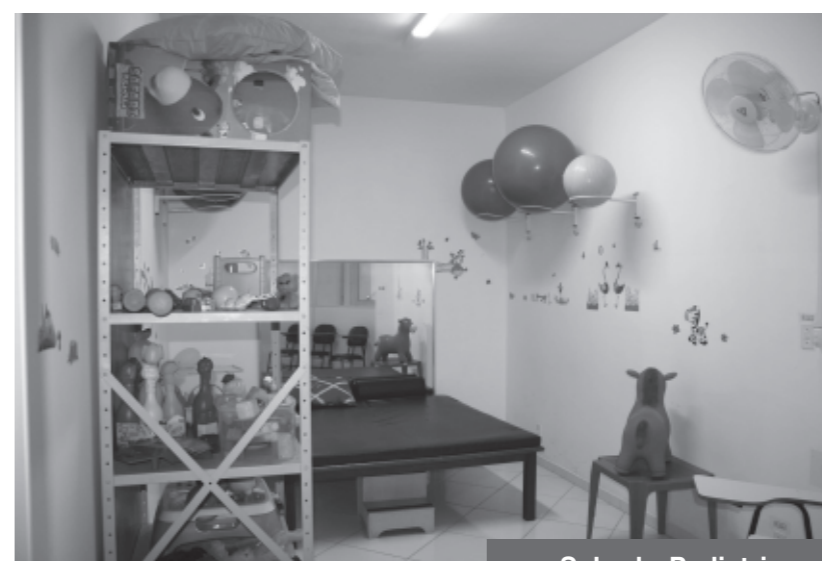
Sala de Pediatria